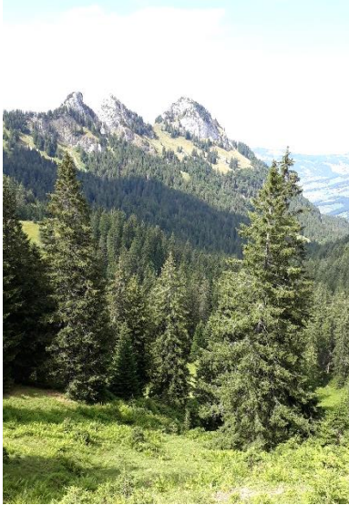
A) Schönwettervariante nach Stein hinunter

Ab der Vorder Höhi folgt der Dessert mit einer genüsslichen Abfahrt.