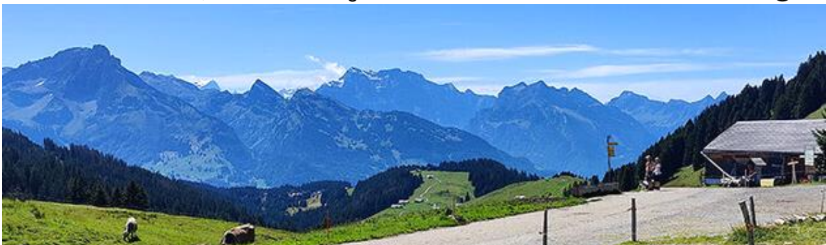
Vorder Höhi 1534m.ü.M. mit Blick auf die Glarneralpen

Vorbeiziehend oder Einkehrend, weiter dem schmalen Höhenweg entlang Richtung Vorder Höhi. Falls Fussgänger unterwegs sind, wäre ein Anhalten, Ausweichen oder langsames Vorbeifahren höflicher, obwohl der Weg schon seinen Reiz hat zum Durchzudonnern 😊