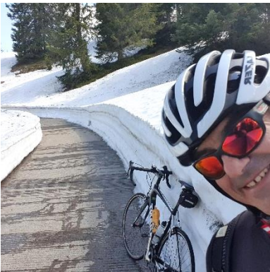
B) Schlechtwettervariante die Strasse nach Starkenbach hinunter

Via Wanderweg den Wald hinab, weiter auf Kieswegen an Streusiedlungen vorbei und später auf asphaltierten Strassen nach Stein.