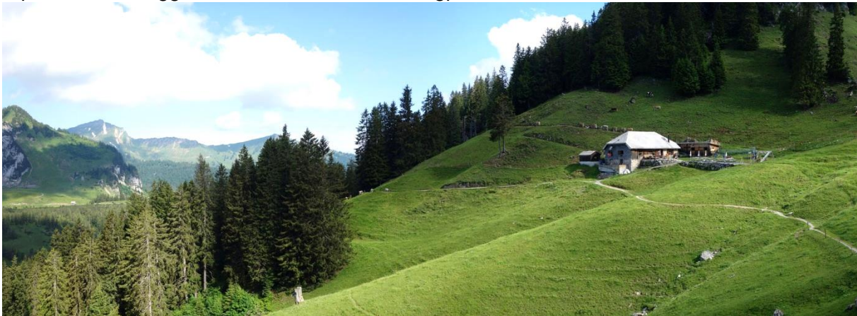
Berggasthaus Furgglen, mit Blick zurück

Scharf links weg, durchqueren wir eine wunderschöne Hochmoorlandschaft, flach geführt auf kinderwagentauglich geführten Wanderweg. Als Bouquet ein kurzer Schlussanstieg zur Alpwirtschaft Furgglen, unserem absoluten Bergpreis dieser Tour.